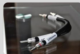
Quintessence ULTIME STRAP