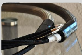
Quintessence ULTIME RCA/XLR

Connectique alliages cuivre, argent et tellure, garantissant très faibles masse et résistivité spécialement traités.