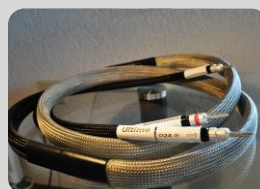
Quintessence ULTIME HP