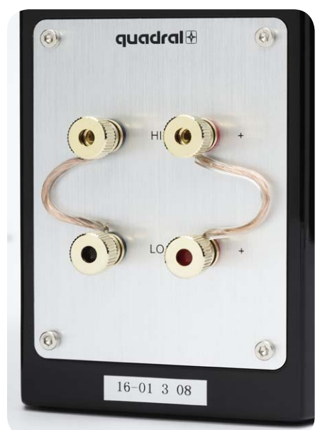
Die Kabelanschlüsse sind besonders hochwertig ausgeführt, was eine optimale Signalübertragung gewährleistet

Test-Kombination ist in Schwarz ausgeführt. Alternativ dazu bietet Quadral eine weiß gelackte Variante. Bei beiden Farben werden schwarze Frontgitter mitgeliefert. Diese sind mit einem feinmaschigem Stoff bezogen. Dank Magnetbefestigung entfallen die sonst üblichen Befestigungsbuchsen in der Schallwand, was das Erscheinungsbild der Signo Avantgarde-Komponenten zusätzlich aufwertet. Hoch-, Mittel- und Tieftöner sind mit silbergrauen Chassiskörben ausgestattet, die sich gekonnt von der dunkelglänzenden Gehäuseoberfläche absetzen. Ein optisch dominierendes Designmerkmal der neuen Baureihe sind die V-förmig gebogenen Schutzbügel über der empfindlichen Abstrahlfläche der Hochtöner.