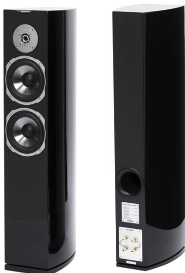
Durch die gerundeten Seitenwangen wirkt die Quadral Signo Avantgarde kraftvoll und elegant