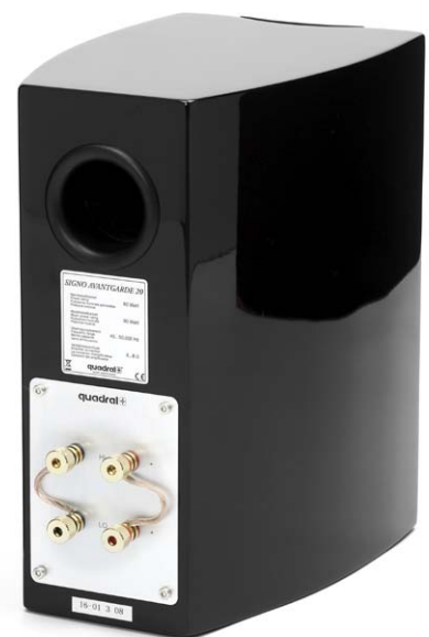
Die Signo Avantgarde 20 kommt als Effektlautsprecher zum Einsatz

Test-Kombination ist in Schwarz ausgeführt. Alternativ dazu bietet Quadral eine weiß gelackte Variante. Bei beiden Farben werden schwarze Frontgitter mitgeliefert. Diese sind mit einem feinmaschigem Stoff bezogen. Dank Magnetbefestigung entfallen die sonst üblichen Befestigungsbuchsen in der Schallwand, was das Erscheinungsbild der Signo Avantgarde-Komponenten zusätzlich aufwertet. Hoch-, Mittel- und Tieftöner sind mit silbergrauen Chassiskörben ausgestattet, die sich gekonnt von der dunkelglänzenden Gehäuseoberfläche absetzen. Ein optisch dominierendes Designmerkmal der neuen Baureihe sind die V-förmig gebogenen Schutzbügel über der empfindlichen Abstrahlfläche der Hochtöner.