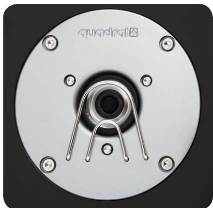
Der Hochtöner besitzt zwei Metallbügel, um die empfindliche Abstrahlfläche zu schützen

der Kunststoff-Frontplatte verbunden und können nicht abgenommen werden. Für die effektvolle Tiefbasswiedergabe in einem Heimkino ist der Subwoofer zuständig. In dem hier vorstelligen Quadral-Set sorgt der Qube 10 Aktiv für die Langwellenwandlung. Wie der Name vermuten lässt, arbeitet der würfelförmige Tieftonlautsprecher über einen zehn Zoll großen Konustöner. Dieser wirkt in einem Bassreflexgehäuse und strahlt nach unten, gegen die Stellfläche ab. Um den korrekten Abstand zum Boden sicherzustellen, thront der Qube 10 auf kantigen dicken Füßen. Das auf der Rückseite eingelassene Aktivmodul beherbergt eine digitale Endstufe mit 280 Watt Leistung sowie alle wichtigen Regler und Anschlüsse. So ist neben dem obligatorischen Lautstärken- und Trennfrequenzregler ein Phasenschalter zur Laufzeitkorrektur vorhanden. Für den Anschluss an einen Stereoverstärker ohne Niederpegel-Ausgänge stehen zwei Paar Kabelanschlussklemmen zur Verfügung. Eine stromsparende Bereitschaftsschaltung rundet den Ausstattungsumfang ab.