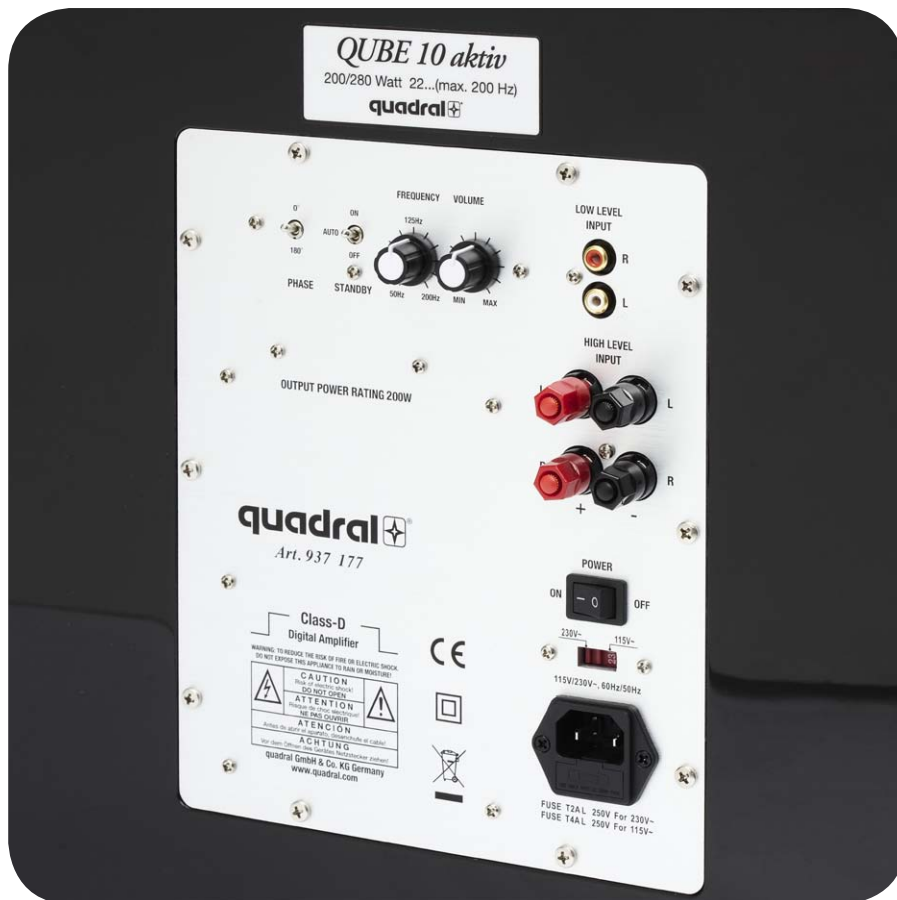
Am Anschluss- und Bedienfeld des Subwoofers werden Lautstärke, Trennfrequenz, Phase und Betriebsmodus eingestellt

Autor: Philipp Schäfer