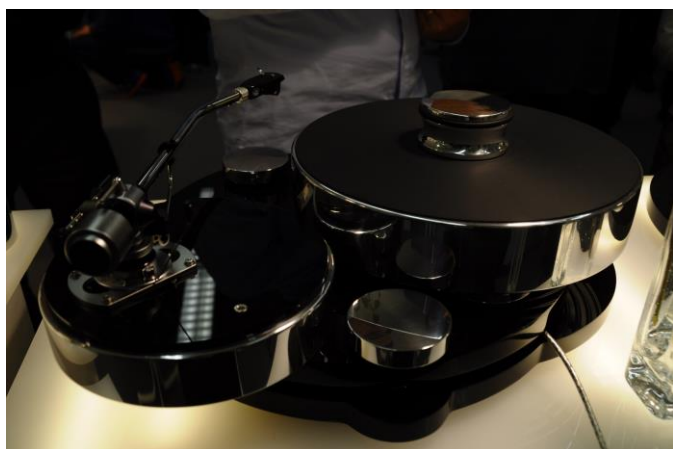
Transrotor Jupiter avec SME

http://www.sonimage.com/wp-content/uploads/2015/07/SON-IMAGE-NEWS-N15.pdf