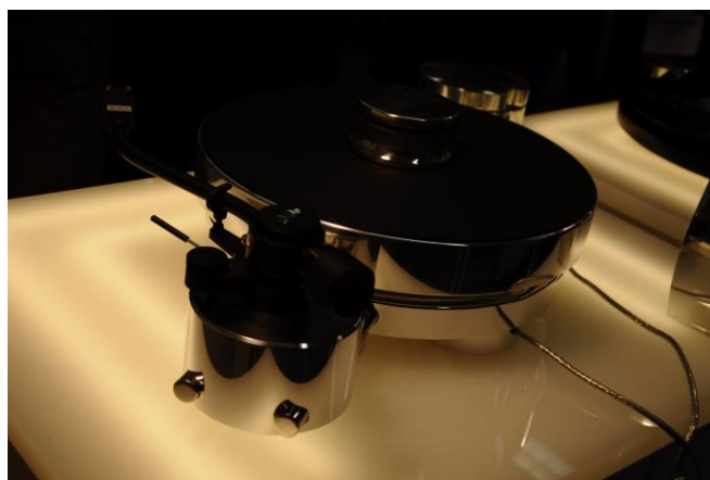
Transrotor MAX avec le bras

info@conceptas.li www.o2acables.com 06 52 09 59 27